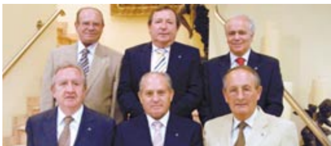
Junta Directiva de la Mutualidad resultante de las elecciones