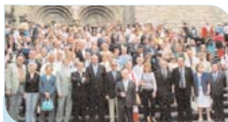
Fotografía de los asambleístas en las escaleras de la Catedral de Santiago.